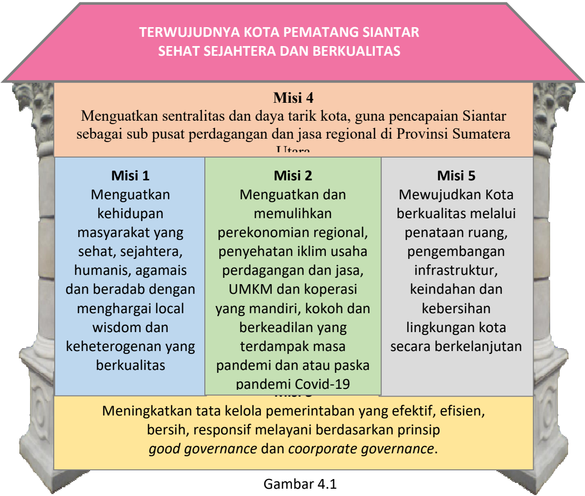
Gambar 4.1 Struktur Visi dan Misi

Gambaran atas uraian visi dan misi selanjutnya dapat dilihat dalam ilustrasi struktur berikut.